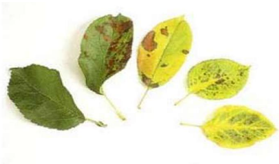
Différents stades des symptômes de carence en magnésium.

⇒ Des carences induites en magnésium sont fréquentes en verger en début d'été (jaunissements et chutes de feuilles). Elles doivent être corrigées uniquement par application foliaire si le sol est bien pourvu.